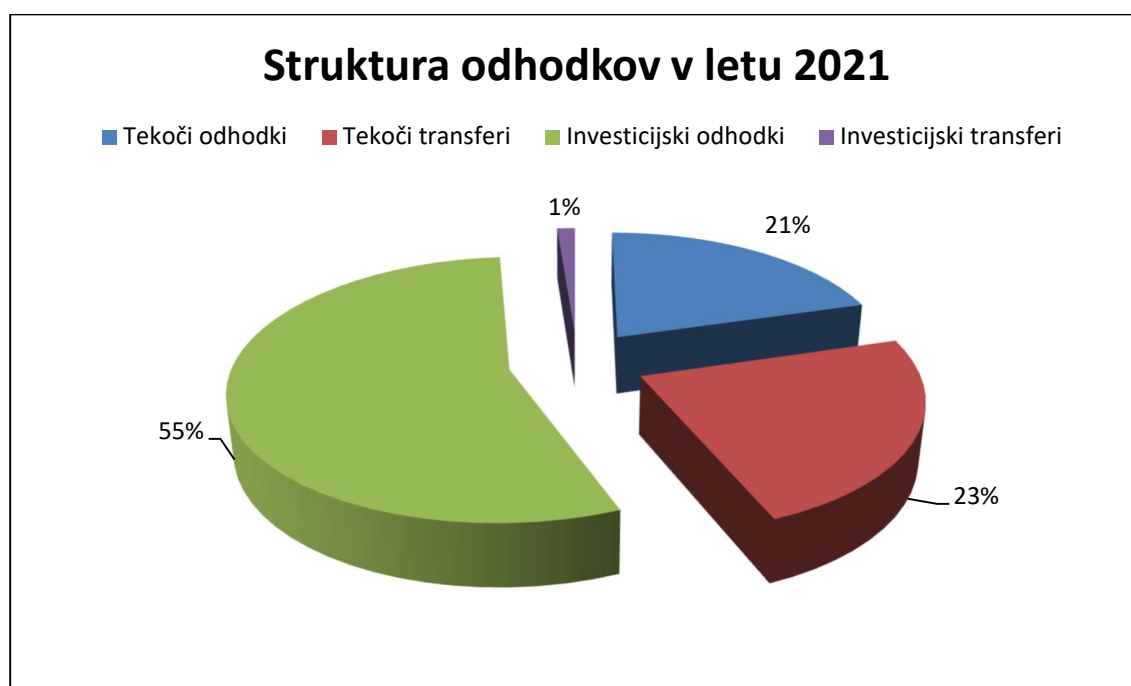
Slika: Struktura odhodkov proračuna občine Ilirska Bistrica za leto 2021

Po ključnih sklopih odhodkov ekonomske klasifikacije je predlagan obseg odhodkov v proračunu Občine Ilirska Bistrica za leto 2021 v višini 26.526.019 evrov.